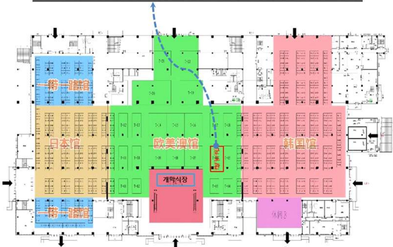
[군포시관 위치 : Hall 1 T-6, 1 st floor]